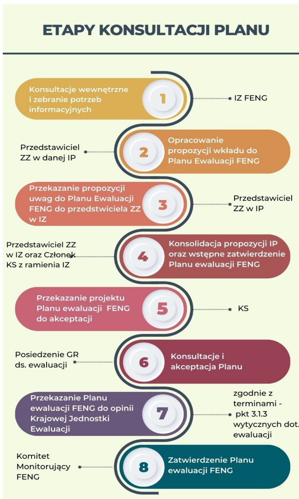
Rysunek 1. Etapy konsultacji Planu ewaluacji FENG lub jego aktualizacji